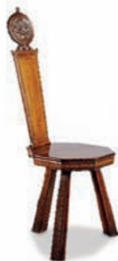
Esp. Metropolitan Museum of Art New York - Fletcher Fund.

TRIPEDE INTERPRETA E RIVISITA, IN CHIAVE MODERNA L'ESSENZA DELLA "FIORENTINITÀ": CELEBRAZIONE DELLA SEDUTA A TRE GAMBE REALIZZATA DA BENEDETTO DA MAIANO (1400) PER L'ARREDAMENTO DI PALAZZO STROZZI; RIEVOCAZIONE DELLO STILE BAROCCO NELLE CURVE ROTONDE DELLE DUE GAMBE POSTERIORI.